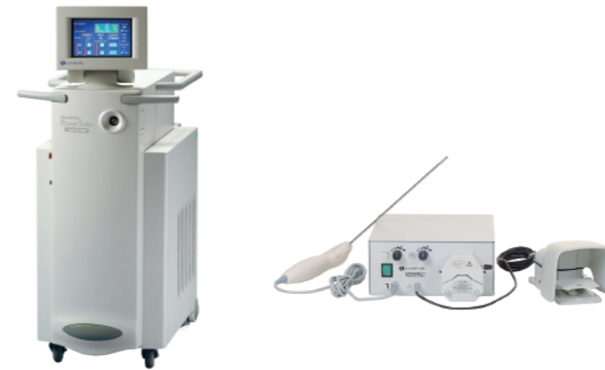
バーサパルス ホルミウムレーザー