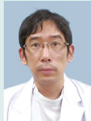
消化器内科副部長／内視鏡室長 国際医療福祉大学 医学部准教授